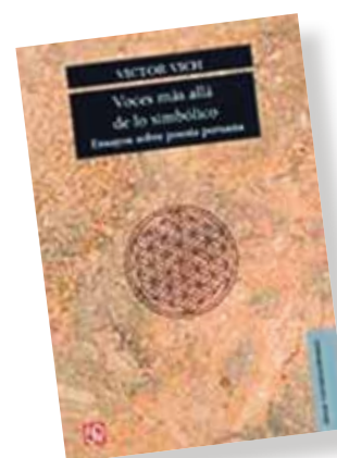
● LA VENTA. Encuétralo en la Librería PUCP a S/. 40.

Vich (Lima, 1970) es doctor en Literatura Hispanoameri-