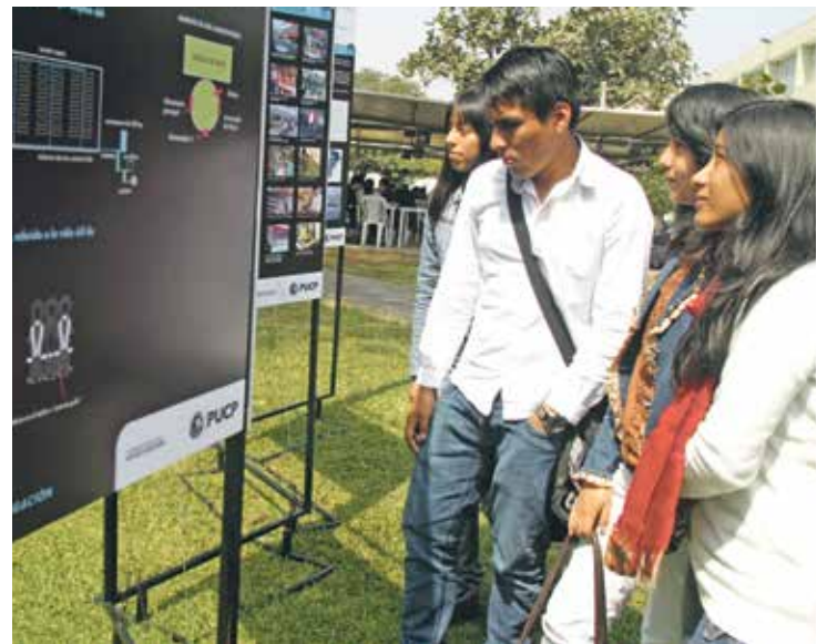
A propósito del Mes de la investigación 2013 se han instalado paneles informativos en los que se explican algunos de los proyectos realizados por los diversos grupos de la Universidad.