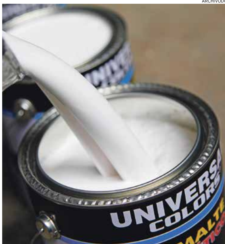
ECOLÓGICOS. Las pinturas industriales de bajo impacto ambiental para barcos pesqueros son solo uno de nuestros proyectos de innovación.

El II Encuentro de Innovación forma parte del Mes de la Investigación PUCP 2013 y se realizará el 24, 25 y 26 de septiembre. Cada uno de los días estará enfocado en los siguientes temas: Ciencias y tecnologías de los materiales, Tecnologías social y ambientalmente sostenibles, y Tecnologías en salud. “La intención es enseñar a los empresarios, al sector público y privado en general, que el trabajo entre empresa y universidad es factible y da resultados positivos para el bienestar social; los proyectos no solo tienen un fin económico por parte de las empresas, sino también existe un fin social, que es