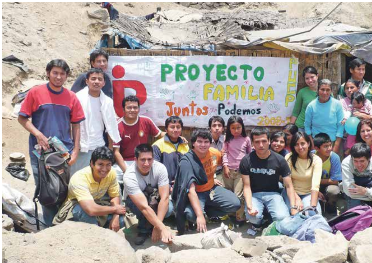
EN COMUNIDAD. Los proyectos pueden abarcar temas diversos, tales como vivienda, salud, educación, asesoría legal, microempresa,

Indudablemente, vivir esta experiencia ayudará al alumno a conocer, de primera mano, la realidad que viven muchos peruanos y a darse cuenta de que, a pesar de no tener muchos fondos, pero sí mucha voluntad, poseen una capacidad transformadora y pueden incidir de manera positiva en las familias.