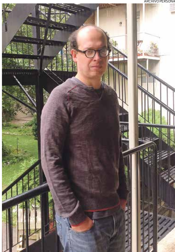
ANÁLISIS. Vergara ofrece una mirada crítica de nuestra realidad política.

mute en algo socialmente más progresista, menos provinciano, menos cucufato. No sé cómo se consigue eso. A mí, honestamente, me gustaría saber cuántos de nuestros millonarios están abonados al Financial Times , hacerle un seguimiento a ese indicador sería un estupendo ejercicio para saber si mejoramos en la calidad de nuestra élite o si tenemos millonarios que leen la misma porquería que cualquier chofer de combi.