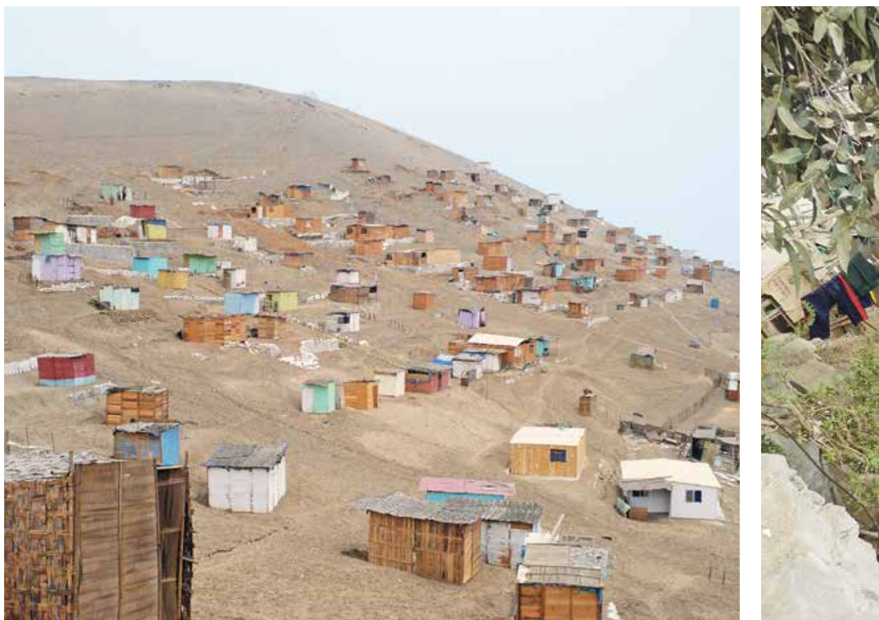
FACEBOOK. Para más información sobre este proyecto, búscalos en Facebook como PROYECTO FAMILIA - PUCP.