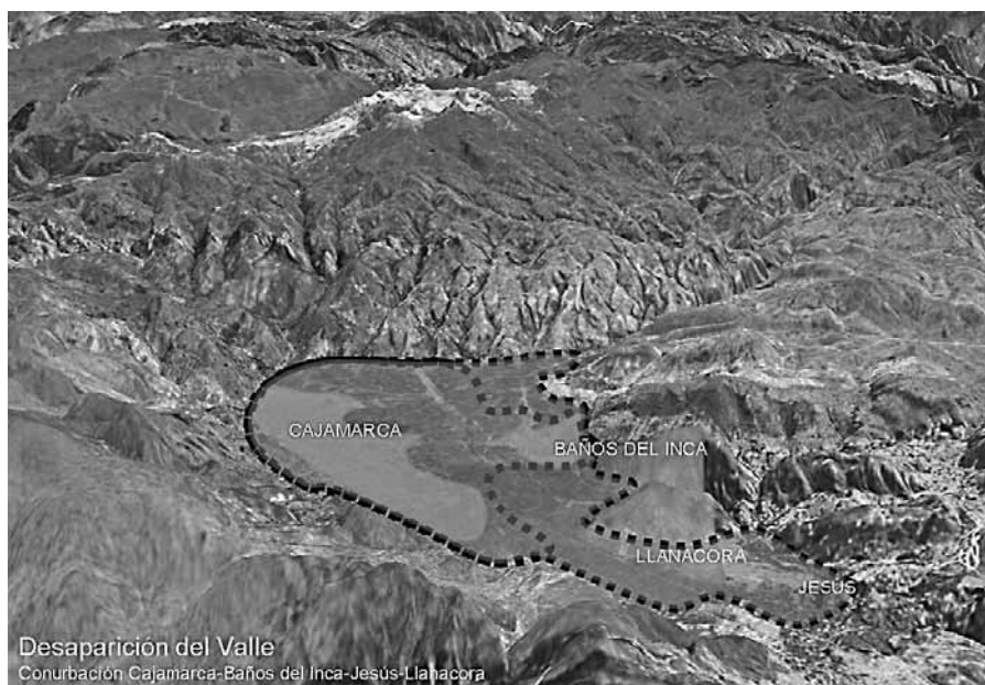
Proyección del crecimiento urbano de Cajamarca. Esquema elaborado por Jorge Solano (CIAC)