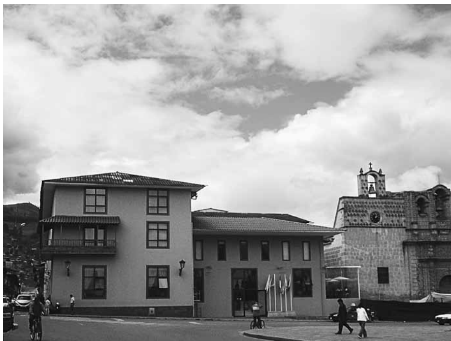
Hotel Costa del Sol opacando a la Catedral

Esta construcción expresa el advenimiento de un nuevo poder dentro de la ciudad que impone nuevas lógicas constructivas urbanas que expresan las aspiraciones y necesidades de nuevas élites urbanas e inciden también en los comportamientos de otros sectores sociales, que han iniciado la destrucción de casonas deterioradas del centro histórico para habilitar edificios nuevos, de ladrillo y concreto, pero de muy poco o nulo valor arquitectónico. Del mismo modo, existen indicios de que los servicios de restaurantes buscan transformarse para atender a un nuevo público que exige mayores niveles de refinamiento. Inclusive, universidades privadas como