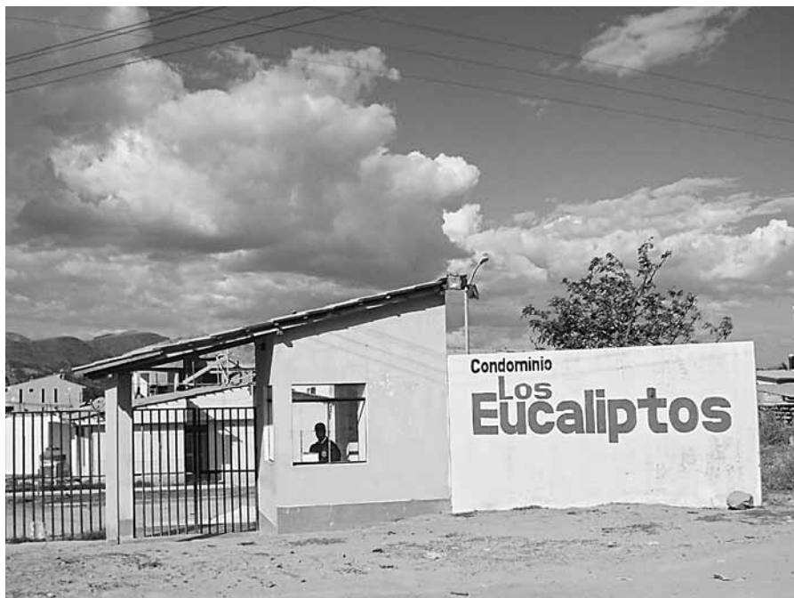
Condominios en Baños del Inca, introducción de la urbanización exclusiva

Se comienza entonces a edificar una suerte de nueva ciudad que ignora o tiende puentes frágiles con la preexistente. En otros términos, podríamos señalar que Cajamarca se convierte en un extraño experimento, donde un tejido de nodos comienza a desarrollarse sobre la base de una ciudad compacta de tipo tradicional.