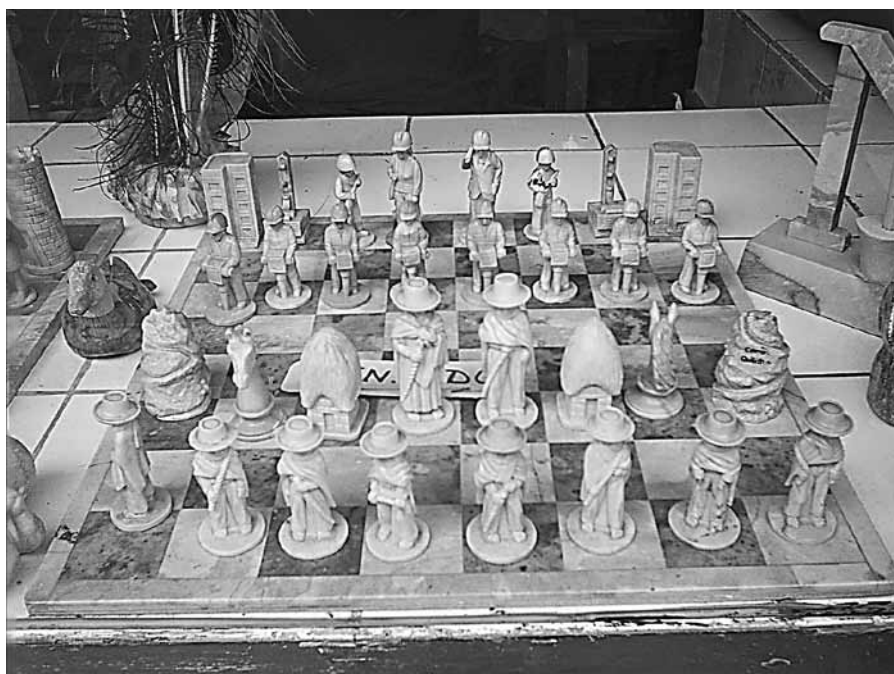
Tablero de ajedrez con mineros contra campesinos como fichas, dualidad de base en el imaginario actual