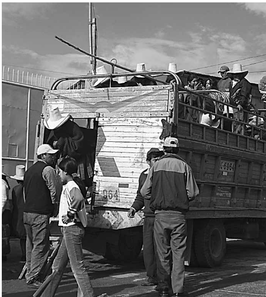
Campesinos en la ciudad

La ciudad, administrativamente se organiza dentro de un solo distrito, pero a su interior la estructura organizativa de tipo barrial todavía mantiene regular vigencia, la cual se expresa ritualmente durante las fiestas de carnaval. En la ciudad, ciertas prácticas religiosas como los cortejos fúnebres continúan llevándose a cabo a manera de peregrinación: los deudos y acompañantes se trasladan caminando desde la iglesia hasta el cementerio de la ciudad.