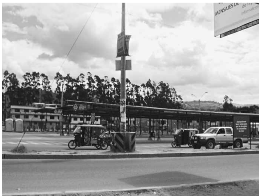
Paradero de autobuses de Yanacocha, hito visible en la vía de evitamiento

Simultáneamente, se generan otros impactos urbanos cuya relación con la explotación minera no es tan explícita, pero si se observa con cuidado, se verá que están estrechamente relacionados con esta actividad, pues son inducidos por actores sociales que reciben recursos derivados de la explotación minera que invierten en la ciudad: unos quieren obtener mayores ganancias por sus propiedades, y los otros, los foráneos, desean reproducir estilos de vida y de urbanización metropolitanos.