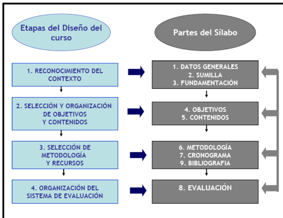
Fig. 1 Etapas del proceso del diseño del curso y partes del sílabo

Estas etapas dan lugar a las cuatro unidades temáticas del curso